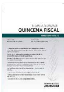
Quincena Fiscal, N.º 22 (2022)

La configuración de los gravámenes temporales energético y de entidades de crédito y establecimientos financieros de crédito