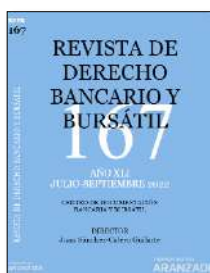
Revista de derecho bancario y bursátil, N.º 167 (2022)

El grado de madurez en los menores de edad. Dificultades en su valoración y apreciación