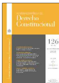
Revista española de derecho constitucional, N.º 126 (2022)

El estatuto del diputado Nuevos y viejos problemas = Status of members: New and old problems