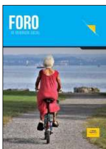
Foro de Seguridad Social, N.º 30 (2022)

El tratamiento de la edad de jubilación en la reforma de las pensiones de 2021