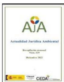
Actualidad Jurídica Ambiental. N.º 129 (2022)

Análisis de la nueva Ley de Residuos, 7/2022, de 8 de abril y sus implicaciones en la corresponsabilidad de la gestión de residuos en la industria textil = Analysis of the new Waste Law, 7/2022, April 8th and its implications in the waste management co-responsibility in waste recovery