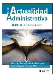
Actualidad administrativa, n.º 12 (2022)

Crónica de una muerte anunciada: el futuro de la Carta de la Energía