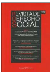
Revista de Derecho Social, N.º 99 (2022)

Efrén Borrajo Dacruz (1928-2022): la construcción del Derecho Social del Trabajo y de la Seguridad Social desde el «personalismo jurídico», el normativismo realista y el «Derecho vivo del Trabajo» = EFRÉN BORRAJO DACRUZ (1928-2022): the construction of the Social Law of Labor and Social Security from «legal personalism», realistic normativism and the «Living Law of Labour»