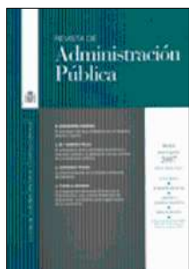
Revista de administración pública, N.º 219 (2022)

Ley 9/2022, de 23 de noviembre, de régimen jurídico y de procedimiento de las actividades sujetas a autorización ambiental integrada: (BOIB 29 noviembre 2022)