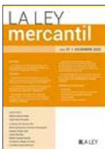
La Ley mercantil, N.º 97 (2022)

Notas sobre el convenio con modificación estructural en la reforma del Texto Refundido de la Ley Concursal