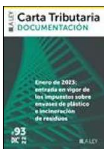
Carta tributaria, N.º 93 (2022)

Segundo ejercicio resuelto del proceso selectivo para el ingreso en el Cuerpo Técnico de Hacienda (turno libre)