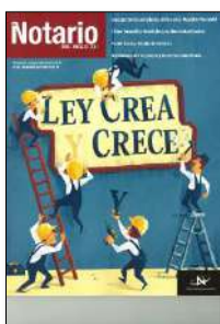
El notario del siglo XXI, N.º 106 (2022)

Regulación insurtech en Chile : seguros inclusivos y coberturas paramétricas