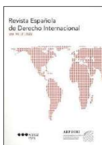
Revista española de derecho internacional, N.º 74-2 (2022)

The economic policy of the European Union in the context of the Covid-19 crisis