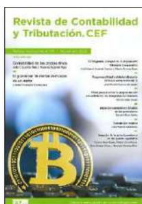
Revista de contabilidad y tributación, N.º 476 (2022)

El método de cálculo de la deducción por doble imposición internacional de las personas físicas: refutación de la errónea interpretación realizada por la AEAT del art. 80 de la Ley del IRPF = The calculation method of the international double taxation deduction of individuals: refutation of the erroneous interpretation made by the AEAT of article 80 of the Personal Income Tax Law