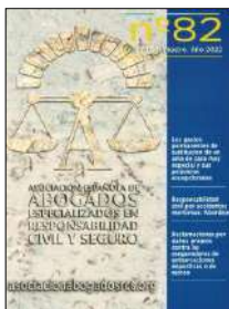
Revista de la Asociación Española de Abogados Especializados en Responsabilidad Civil y Seguro, N.º 82 (2022)

A propósito del seguro obligatorio de viajeros