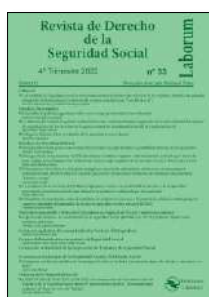
Revista de Derecho de la Seguridad Social, N.º 33 (2022)

Las medidas de Seguridad Social y otros instrumentos de protección social en la ley orgánica 10/2022, de garantía integral de la libertad sexual (conocida de manera popular como «Ley del sí es sí») = The Social Security measures and other social protection instruments in the organic law 10/2022, comprehensive guarantee of sexual freedom (popularly known as «Yes is Yes Law»)