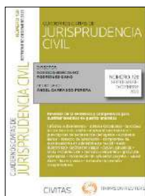
Cuadernos Civitas de Jurisprudencia Civil, N.º 120 (2022)

Revocación de autorizaciones administrativas ante blanqueo de capitales