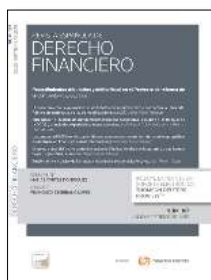
Revista española de derecho financiero, N.º 196 (2022)

La perspectiva de género en el ámbito tributario