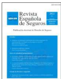
Revista española de seguros, N.º 191 (2022)

Empresas de tecnología e innovación en el sector asegurador. En transformación y en tránsito con las empresas insurtech