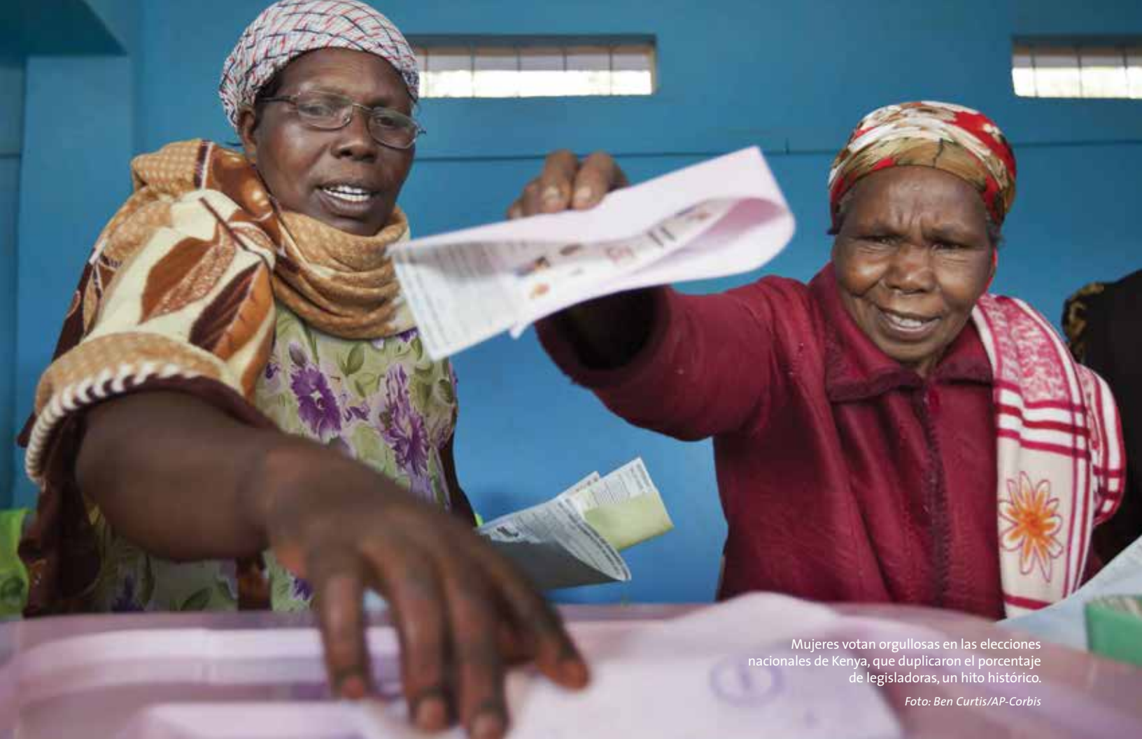
Mujeres votan orgullosas en las elecciones nacionales de Kenia, que duplicaron el porcentaje de legisladoras, un hito histórico.