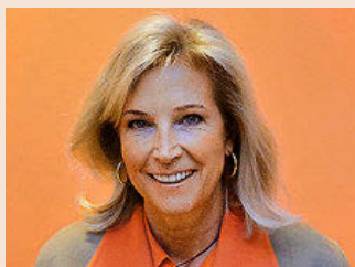
María Dolores Dancausa, consejera delegada de Bankinter.

La prima de riesgo se acomodará en España por debajo de los 100 puntos P21