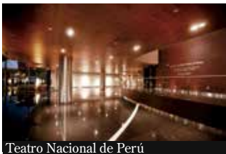
Teatro Nacional de Perú