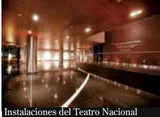
Instalaciones del Teatro Nacional