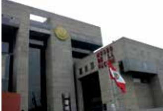
Museo Nacional de Perú