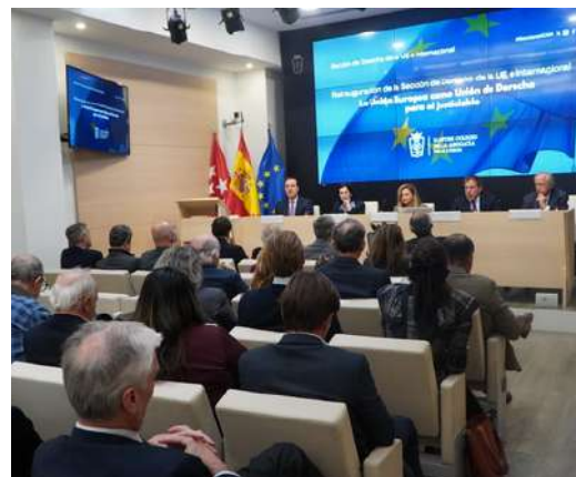
Jornadas de reinauguración de las secciones ICAM de "Reestructuraciones, Insolvencias y Segunda Oportunidad" y de "Internacional y UE" en los meses de septiembre y octubre de 2023

* Secciones inauguradas en 2023: Abogados Penalistas; Aeronáutico y Espacial; Consumo; DDHH; Energía; Familia y Sucesiones; Igualdad; Laboral; Reestructuraciones, Insolvencias y Segunda Oportunidad; Responsabilidad Civil y Seguro; Urbanismo; Arbitraje; Innovación y Abogacía; Iniciación Profesional; Militar y Seguridad; Procesal; Societario, Gobierno Corporativo y Desarrollo Sostenible; Tauromaquia; UE e Internacional.