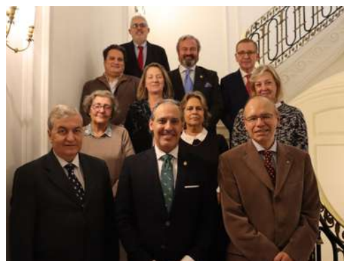
Nueva Junta Directiva UICM

Los profesionales de la región madrileña aportan con su actividad económica más del 23,4 % del PIB de la comunidad y casi un 5% del PIB nacional.