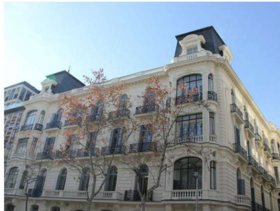
Sede del Colegio de Abogados de Madrid, en el número 9 de la calle Serrano.

La dirección de la institución convocará una junta extraordinaria el 20 de julio para que la abogacía madrileña se pronuncie sobre la adquisición del resto de plantas del emblemático inmueble